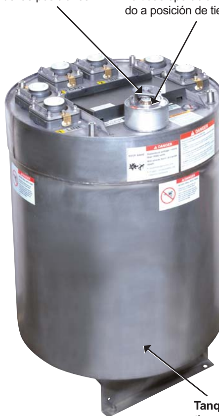
Tanque de acero inoxidable tipo 304L. Su tecnología de sellado proporcionan una larga vida de confiable servicio en ambientes hostiles.

Moto-operador portátil te permite operar el seccionador o el interruptor de falla desde una ubicación remota, particularmente útil para unidades localizadas en subterráneo con otros equipos energizados.