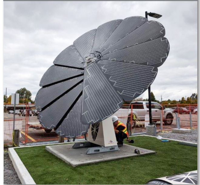
Painel de energia solar no Community Energy Park.

O Community Energy Park é um núcleo de resiliência e um centro de aprendizado para a comunidade de North Bay