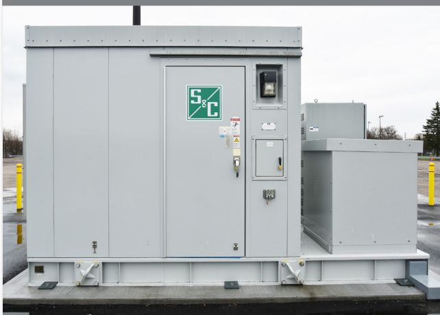
Sistema de armazenamento com baterias do Community Energy Park.

No início da perda de um fornecimento prolongada, o controlador suporta duas respostas diferentes. Ele monitora continuamente se os dispositivos de proteção das subsidiárias respondem e restabelecem o fornecimento para a microrrede. Se o sistema estiver pronto, o controlador trabalha com relés de proteção de atuação rápida para executar uma transferência suave não-planejada, realizando uma transição imediata para o modo ilha, evitando que a microrrede seja afetada por determinados eventos que levariam a uma perda momentânea de fornecimento. Os inversores dos painéis solares são desligados quando ocorrem estas perdas momentâneas, por isso é importante que uma microrrede tenha a capacidade de lidar com esta situação. Isto não somente melhora a confiabilidade quando uma perda prolongada de fornecimento ocorre devido à condições extremas de inverno, como também reduz de forma efetiva as perdas de fornecimento frequentes, apesar de que transitórias, que podem afetar negativamente os recursos de energia distribuída que alimentam a região de North Bay.